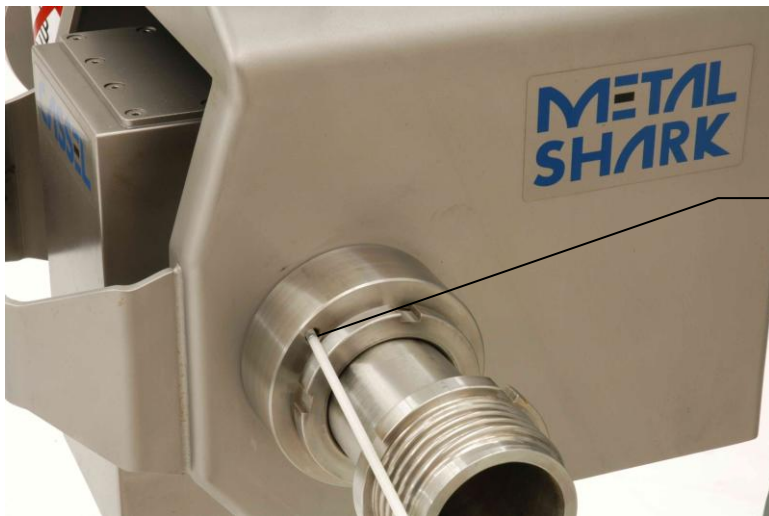
Oeffnung fuer Stab mit Metalltestkugel