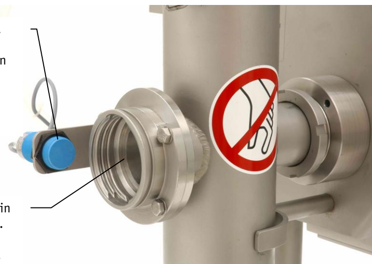
ACHTUNG! Niemals in den Auswurf fassen. Gefahr das Finger gequetscht werden.