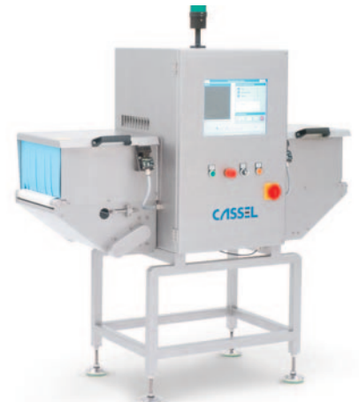
METAL SHARK® X-Ray