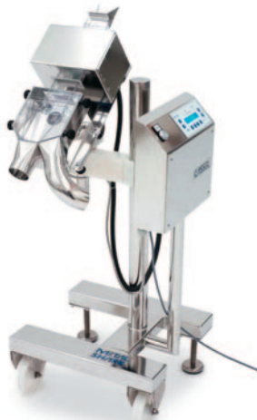
METAL SHARK® PH Pharma