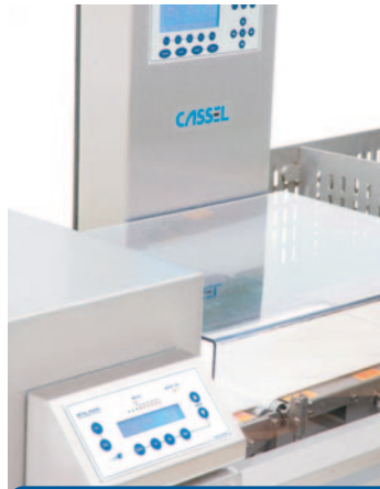
METAL SHARK® Checkweiger