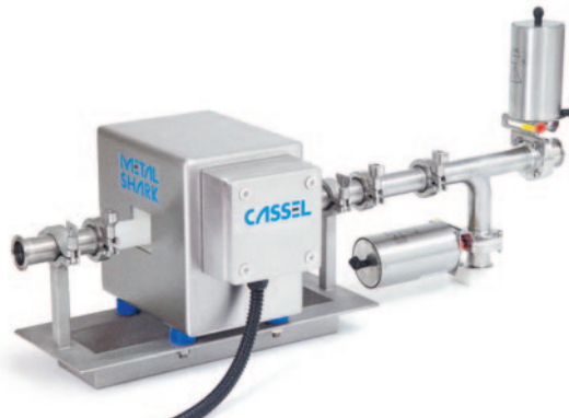
METAL SHARK® IN Liquid