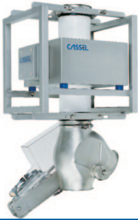
METAL SHARK® GF Fallrohr