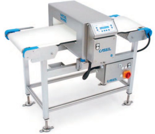
METAL SHARK® HW